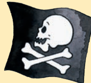
La bandiera di Barbanera