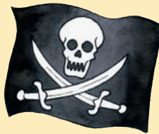
La bandiera di Black Bart