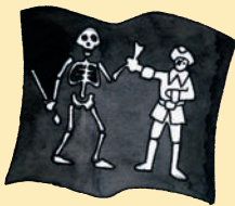
La bandiera di Calico Jack

Ogni comandante aveva la sua bandiera personale, queste erano le più famose: